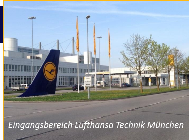
Eingangsbereich Lufthansa Technik München

Ab Flughafen München mit der S1 oder S8 eine Station bis Haltestelle „Besucherpark“ fahren. Da die S-Bahn Station im Flughafen ein Sackbahnhof ist, fahren alle Züge/Linien von beiden Bahnsteigseiten in Richtung „Besucherpark“. Mit dem Besitz des LH-Konzernausweises ist die Fahrt kostenfrei. Die Gebäude DLH Flight Operations Center (FOC), LH Cargo und das Lufthansa Technik Gelände (weiter hinten) befinden sich an der Station „Besucherpark“ in Fahrtrichtung auf der linken Seite. Gehen Sie durch die Glasröhre in Richtung Süden, die Treppen hinunter und am Zaun des FOCs nach rechts. Nach dem Durchqueren des Fußgängertunnels befindet sich das Lufthansa Technik Gelände auf der linken Seite (siehe Grafik).